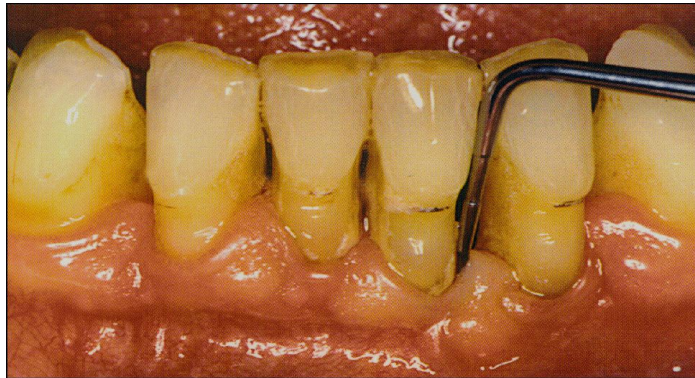
Tandkødslommerne måles med et lille instrument som føres ned langs tanden til man når bunden af lommen.

Den helt nøjagtige tilstand af tandkødet og knoglen, der holder tanden fast, kræver en grundig undersøgelse på klinikken.