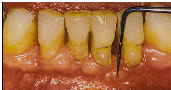
Instrumentet vist uden på tandkødet på en patient med paradentose.